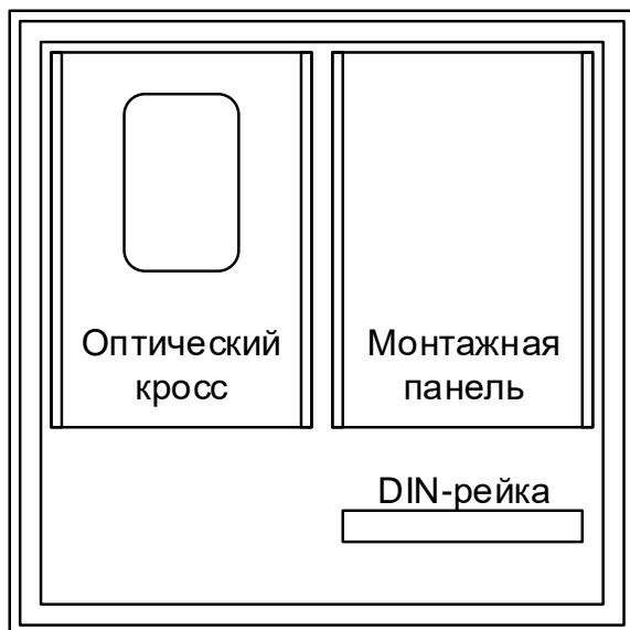
Схема расположения элементов внутри шкафа TFortis CrossBox-3