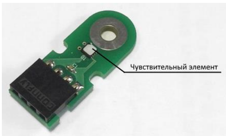
Рис. 1 Датчик температуры и влажности

Датчик температуры и влажности разработан на базе микросхемы серии SHT31 компании Sensirion