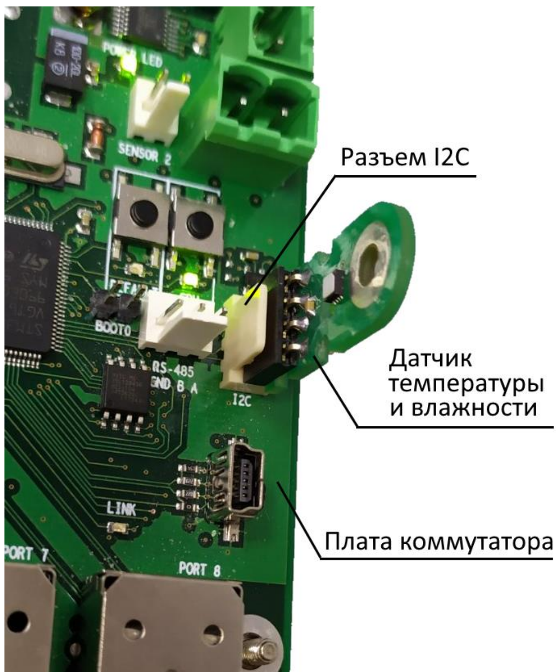
Рис. 4 Установка датчика на плату коммутатора.

Не допускайте смещение датчика, устанавливать четко в гнездо разъема.